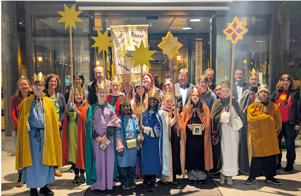
Gruppenbild