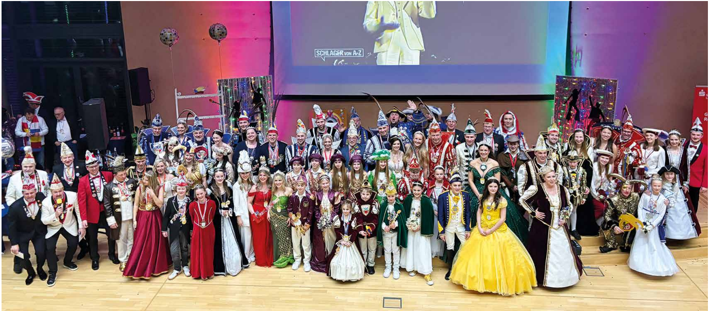
Gruppenbild Fastnachts-Prinzenpaare und Figuren – Foto: Kreis Offenbach

Zur Würdigung und Pflege unseres Brauchtums im Kreis Offenbach lud Landrat Oliver Quilling am Montag, 9. Februar 2026, alle Fastnachts-Prinzenpaare und närrischen Figuren zum alljährlichen Empfang ins Kreishaus nach Dietzenbach ein.