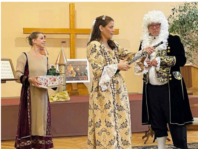
Kinder-mit-mach-Theater Tikato