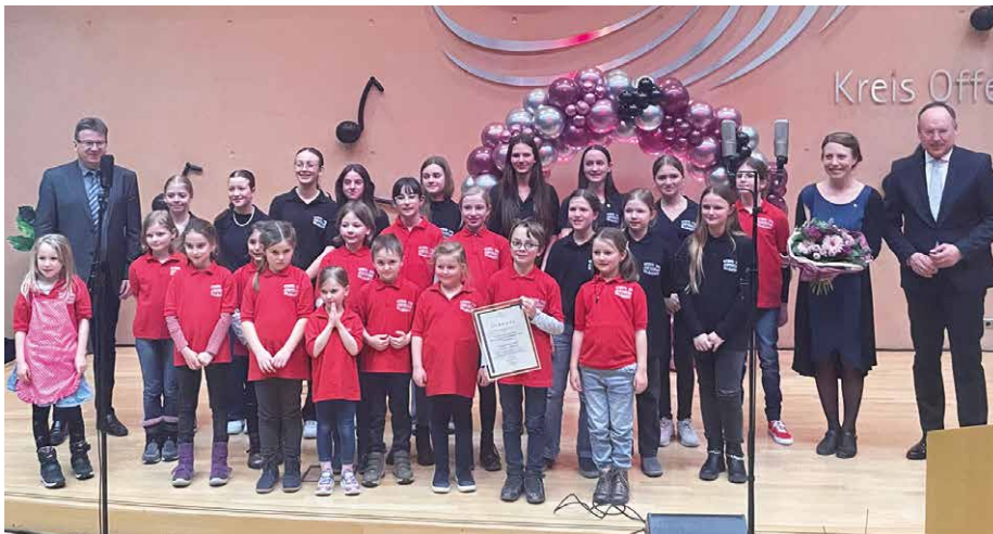
oben: Kinder- und Jugendchor Liederkranz 1903 Zellhausen