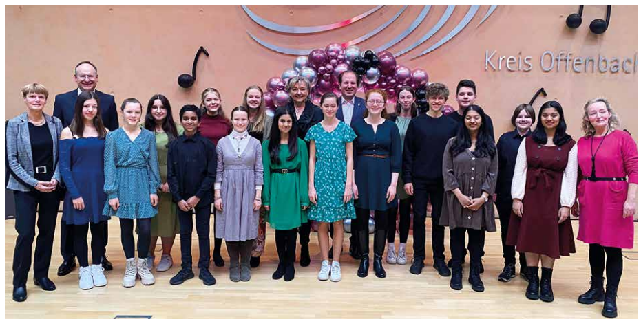
Rechts: RHS Young Voices