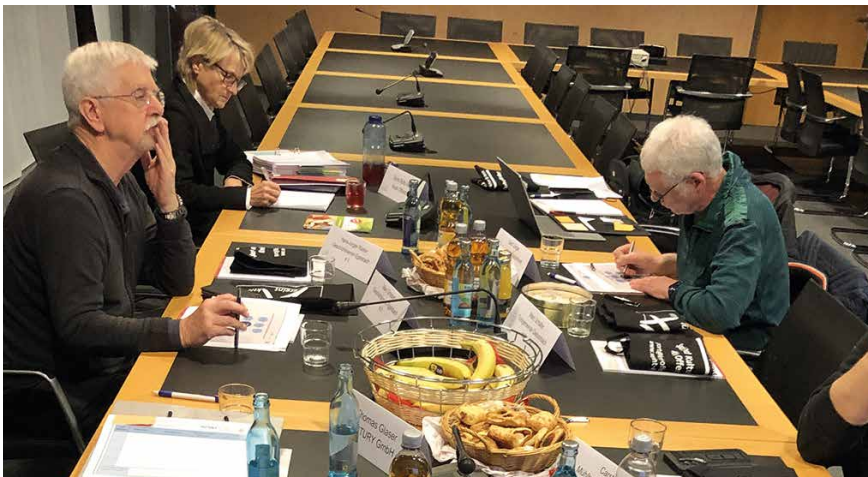
Modellprojekt Workshop

Die Vereine wurden so ausgewählt, dass sie sich in Größe, Ausrichtung, Digitalisierungsgrad und Mitgliederstruktur unterscheiden, um als Vorbilder für möglichst viele andere Vereine zu dienen. Die Turngemeinde Dietzenbach 1886 e.V. sorgt durch ihr Sportangebot für die Gesundheit ihrer Mitglieder und macht als digitaler Vorreiter für Sportvereine mit. Der Geschichtsverein Egelsbach e.V. zeigt mit seiner Teilnahme, dass sich auch ältere Mitglieder in Vereinen Unterstützung bei der Implementierung neuer digitaler Lösungen wünschen. Der Mühlheimer Karneval-Verein e.V. bringt Mitglieder mit den verschiedensten Hintergründen zusammen und dient als Beispiel, wie Digitalisierung in allen Vereinsdimensionen vorangebracht werden kann. Die drei Vereine arbeiten an jeweils eigenen, internen Projekten, um die Digitalisierung in ihrem Verein voranzutreiben.