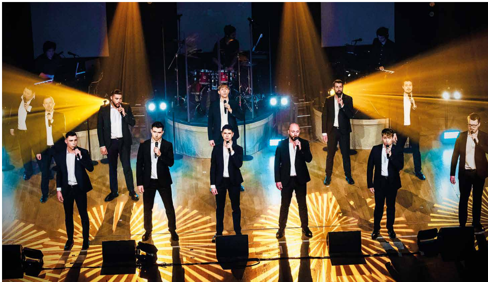
THE 12 TENORS

Der Kreis Offenbach lädt, unterstützt vom Kulturfonds Frankfurt RheinMain sowie dem Kultursommer Südhessen, nach vierjähriger Pause in diesem Sommer wieder zu zwei besonderen Konzerterlebnissen vor der historischen Kulisse des rund 300 Jahre alten Schloss Wolfsgarten bei Langen ein. Am Freitag, 8. September 2023, ziehen „Die 12 Tenöre“ mit ihrem Konzertprogramm „The Power of 12“ das Publikum ab 19:00 Uhr in ihren Bann. Einlass ist ab 17:30 Uhr. Am Samstag, 9. September, lädt das Mainhattan Pops Orchester unter der Leitung von Thorsten Wszolek zu einer musikalischen Zeitreise von den 1910er bis in die 1940er Jahre ein. Das Konzert auf der Open-Air-Bühne vor dem für Landgraf Ernst Ludwig erbauten Jagdschloss findet ebenfalls um 19:00 Uhr statt. Einlass ist ebenfalls ab 17:30 Uhr.