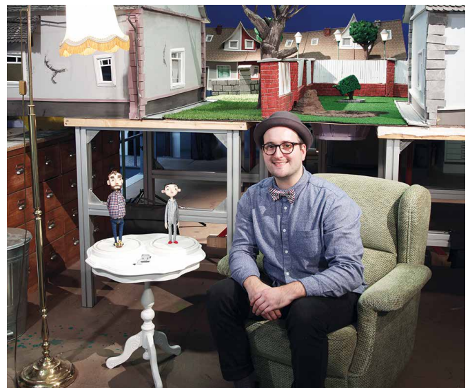
Robert Scheffner

Der Kinderbuchautor und Illustrator Robert Scheffner wiederum spricht während seiner Lesung über die Impulse und die Motivation des Schreibens und Illustrierens von Kinderbüchern.